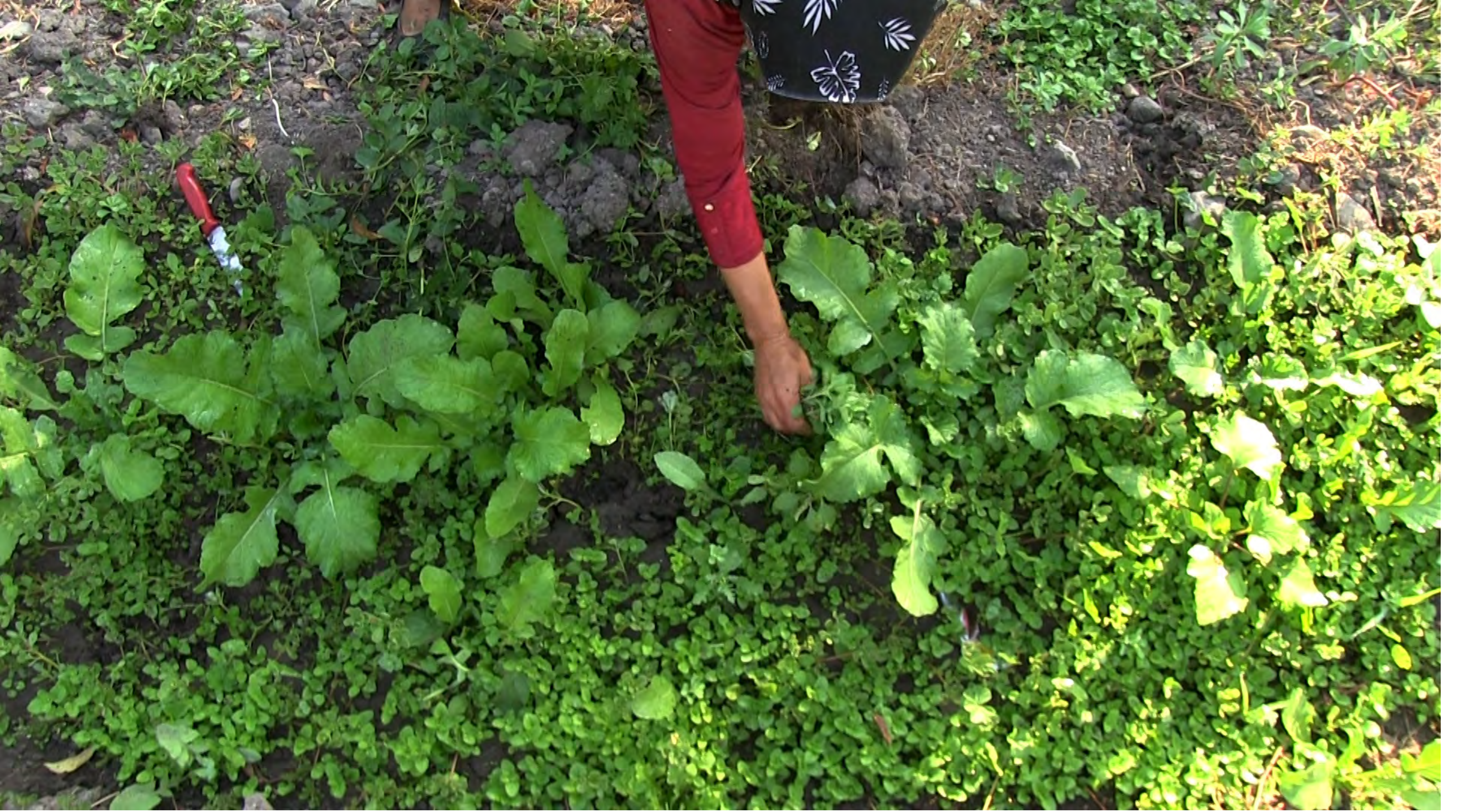
Aşefçiler, Rüyalar, Otlar