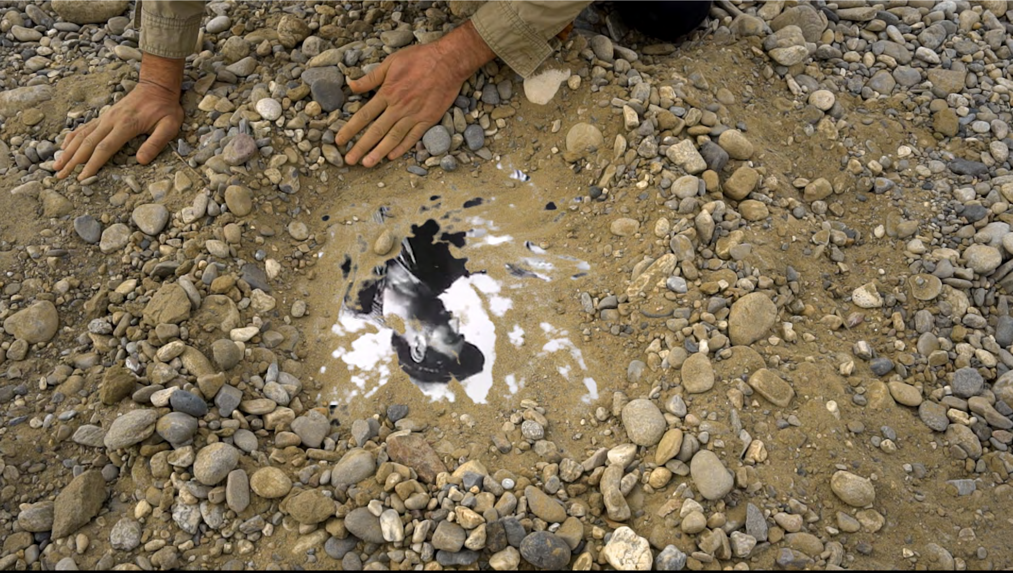
Yönetmen Sibel Öge Video, 6'31", Şubat 2021 Batman

2005'ten bu yana yüzlerce filme, oyuna, konsere, söyleşiye ev sahipliği yapan Batman Yılmaz Güney Sinema Salonu'nun önce yanması, ardından yıkılmasıyla birlikte geride kalan beton alana adım atıyoruz Li Vir (Burada) ile. Geleceği belirsiz, bekleyiş halindeki bu beton boşluk, içine geçmişin sesleri doldukça bir mekâna dönüşmeye başlıyor. Bu mekânın ve içinde paylaşılan kültürün hatırasıyla cadde sesleri duyulmaz olurken, üretmenin, beraber olmanın, dayanışmanın ve paylaşmanın gücü şimdi ve burada bizi etkisi altına alıyor.