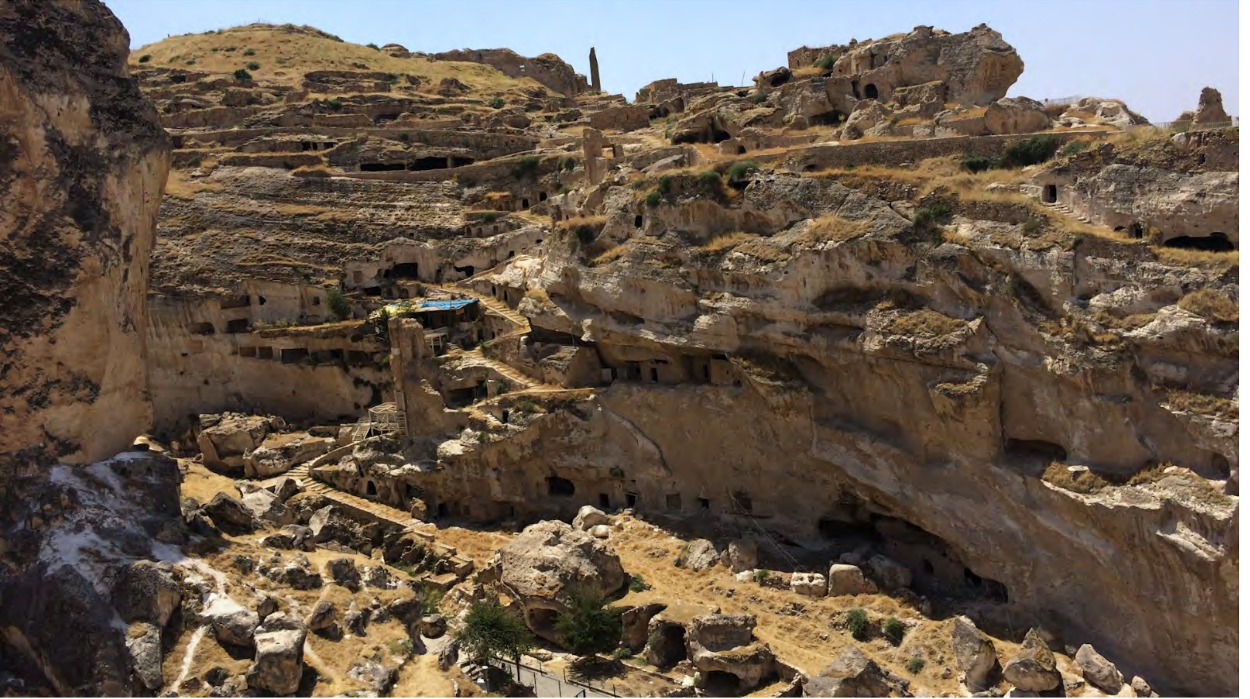
Taş ve Su