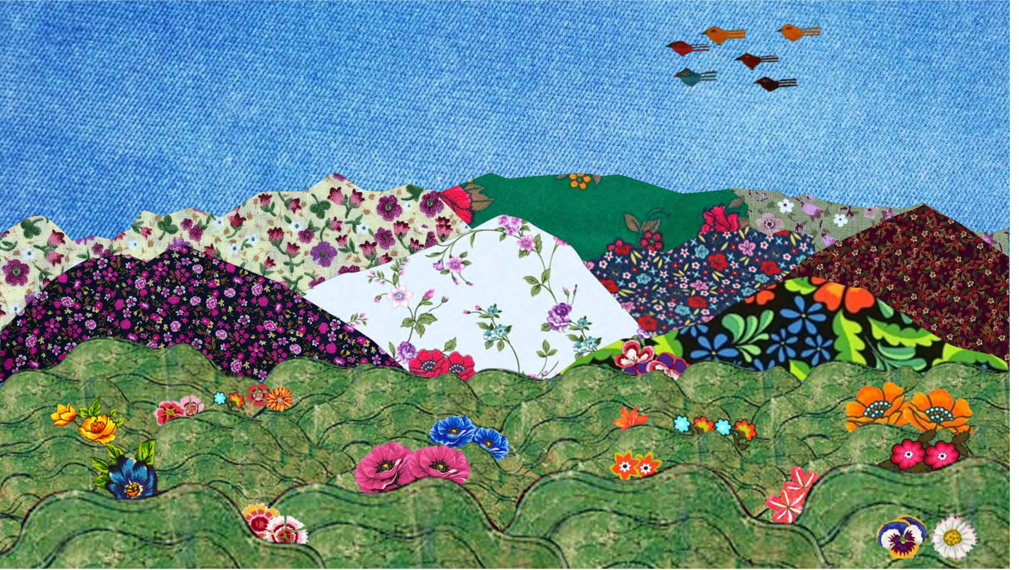
Cûdîyê Miradan (Dileklerin Cudisi)