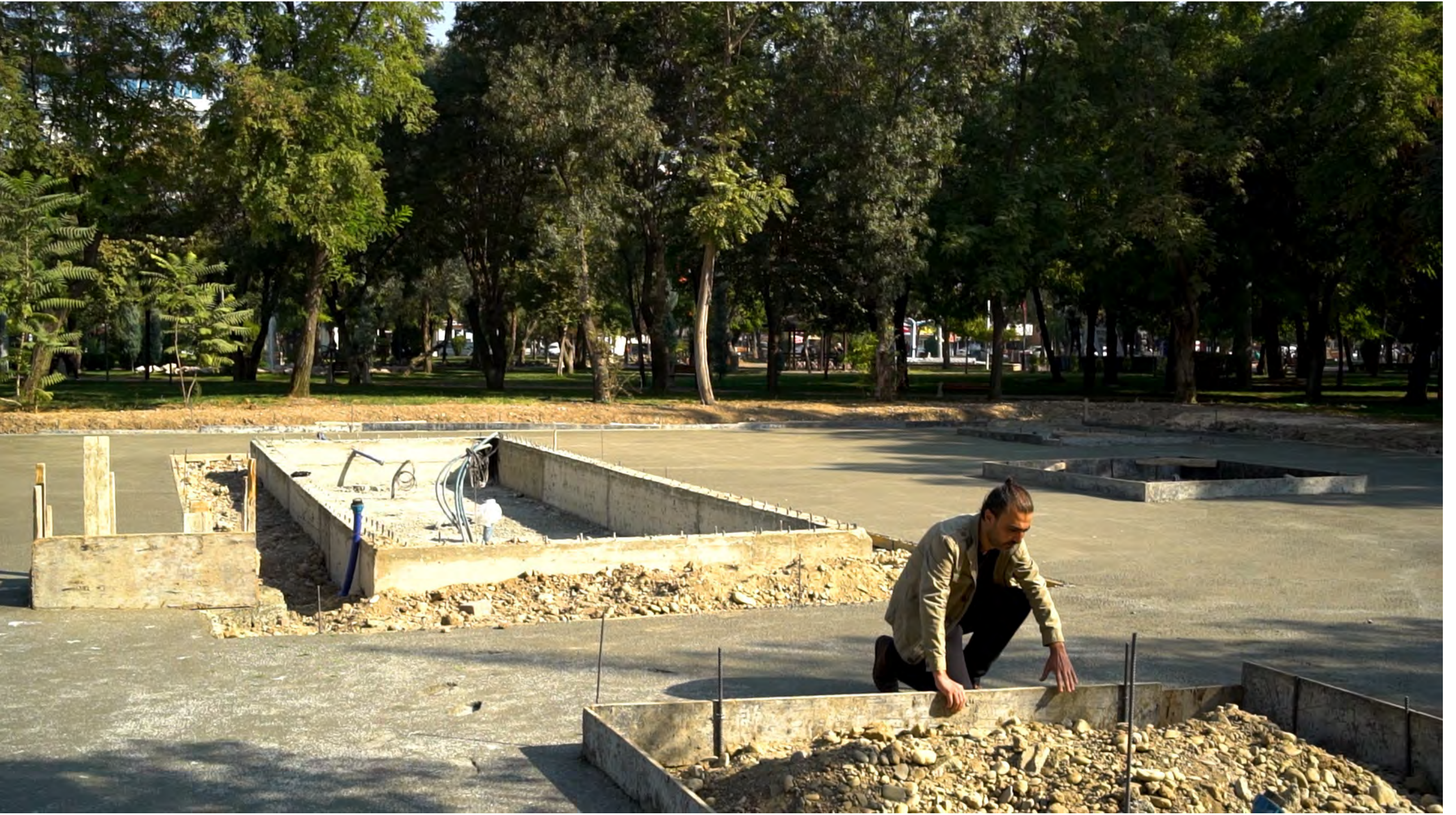
Li Vir (Burada)