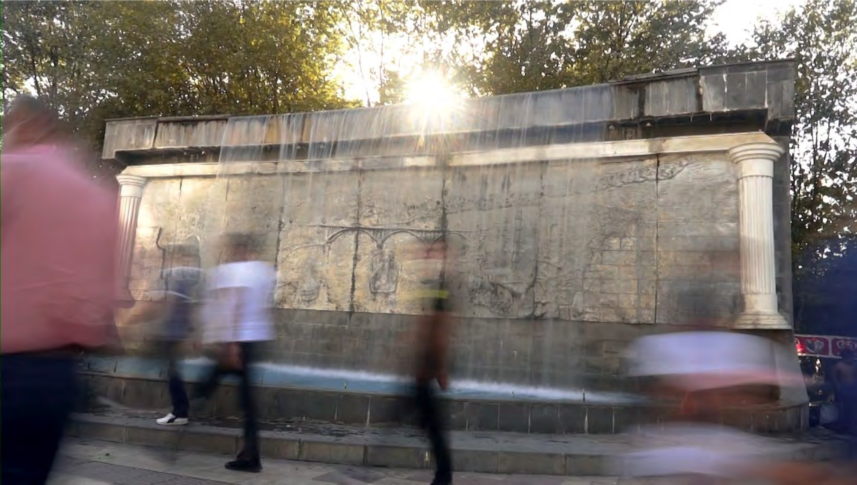
Yönetmen Nalin Acar Video, 5'14", Şubat 2021 Batman

Ilisu Barajı ile sular altında kalan Hasankeyf artık Batman'da sadece bir süs havuzunun duvarlarını süslüyor. Bu süs havuzu da tıpkı tarihî Hasankeyf gibi kendi ekosistemini yaratıyor. Görüntüleri kavramlarla eşleyerek ve aynı kavramlara farklı görüntülerin bağlamında yeniden dönerek ilerleyen Taş ve Su , izleyiciyi yeniden bakmaya ve anlamaya davet ederken tanık olmanın ağırlığına işaret ediyor.