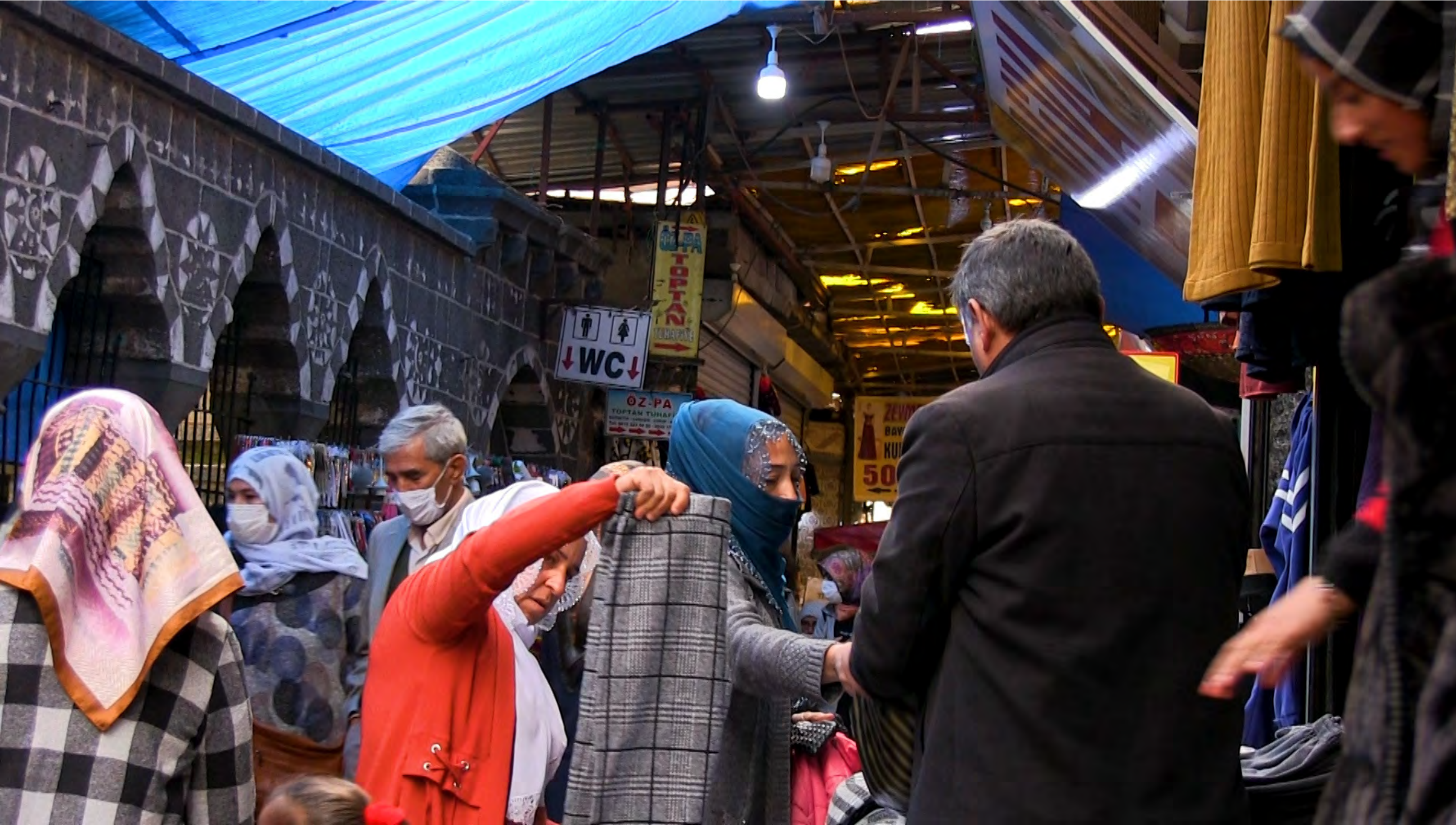
Yönetmen Zelal Sadak Video, 5'21", Şubat 2021 Diyarbakır

Kimsenin tohumunu atmadığı, sulamadığı, çitleriyle topraklarının sınırlarını belirlemediği yerlerde biten otları toplayan kadınları kimler hatırlıyor? Aşefçiler, Rüyalar, Otlar , Diyarbakır Suriçi'ndeki meşhur çarşıya adını veren aşefçi kadınların bugünkü yokluğunu çok sesli bir fısıltılar korosuyla dolduruyor. Çarşının görünmez kılınmış tarihine, aşefçilerin otlarını topladığı Hevsel Bahçeleri'nin ışığı düşüyor.