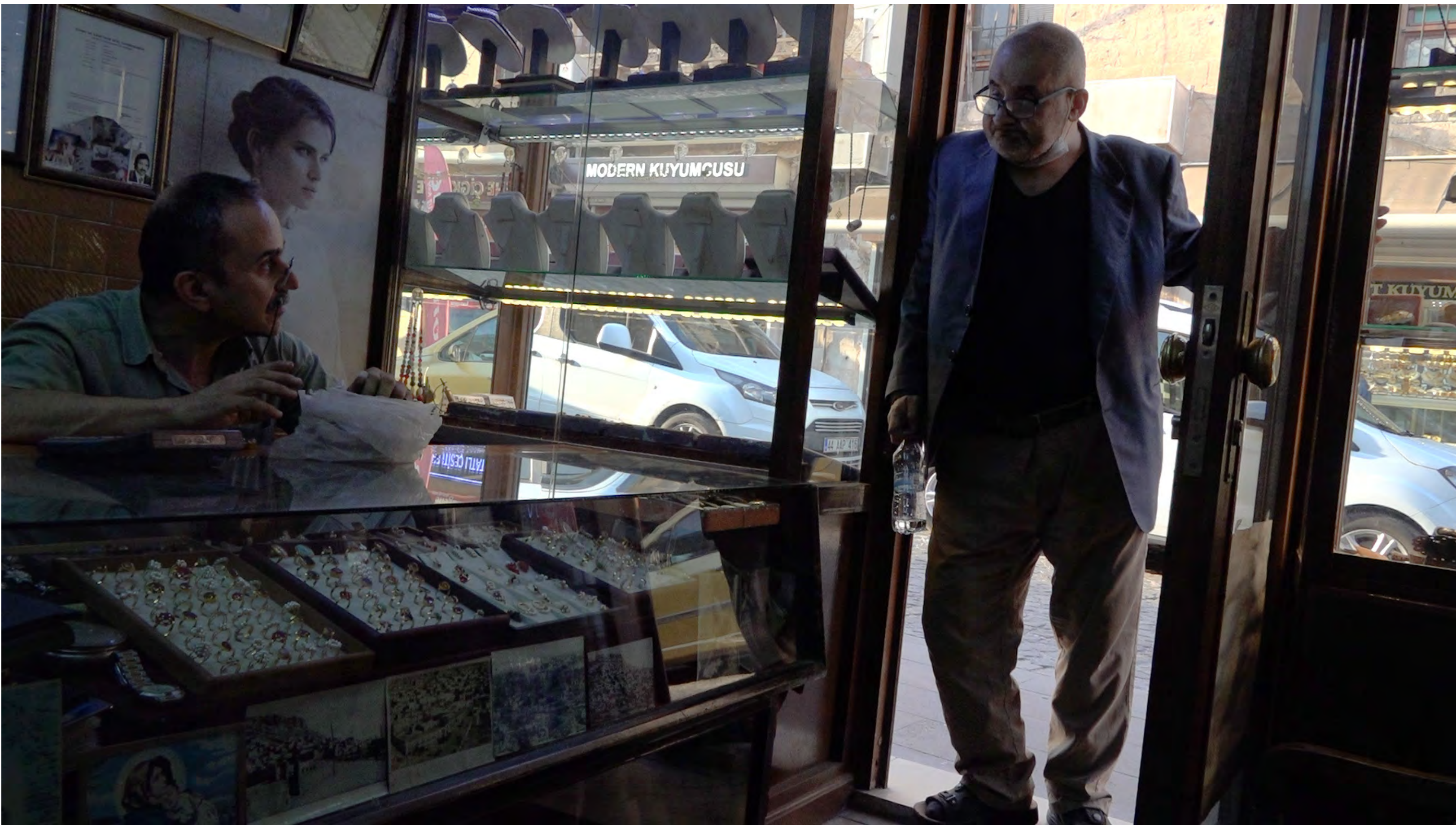
Yönetmen Mediha Güzelgün Video,11'47", Şubat 2021 Mardin